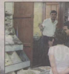
Le souk aux épices.

Nous passons ensuite du côté de Deira et de ses souks arabo-indiens fascinants, sur un abra, aux côtés des travailleurs aux allures hétéroclites qui rentrent chez eux à la fin de la journée. Curieux