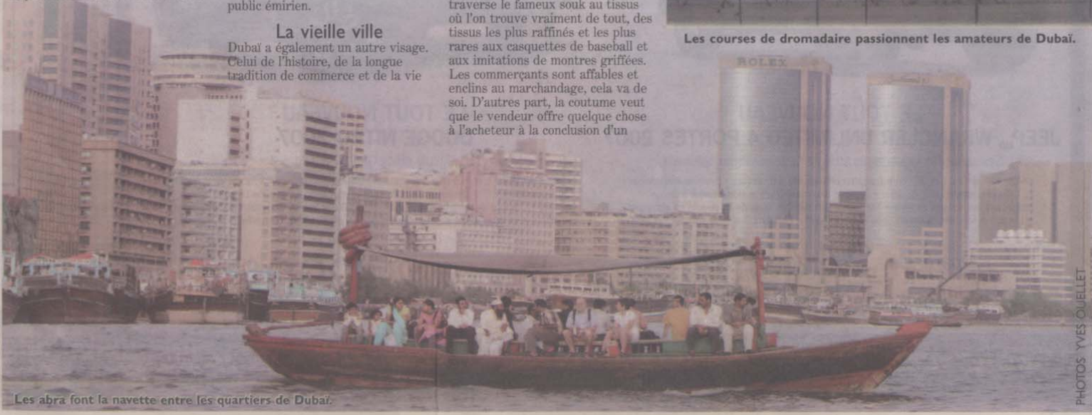
Les abra font la navette entre les quartiers de Dubaï.