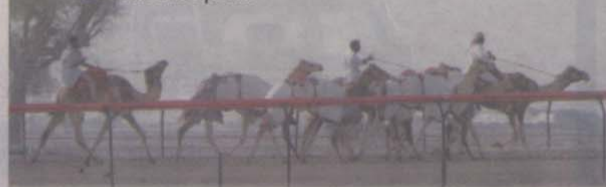
Les courses de dromadaire passionnent les amateurs de Dubaï.