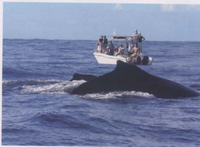
Le clou de votre séjour, si vous avez la chance de descendre au Princesse Bora Lodge de juillet à septembre : l'observation des mégaptères. Ces grands cétacés, voisins des baleines, séjournent chaque année dans la région pour se reproduire et mettre bas.

Des liaisons privées sont également proposées par le Princesse Bora Lodge au départ de l'aéroport de votre choix à Madagascar. Renseignements auprès de l'hôtel. L'établissement est situé à 1 kilomètre de l'aéroport et assure le transfert de ses clients au choix en véhicule ou en char à zébus.