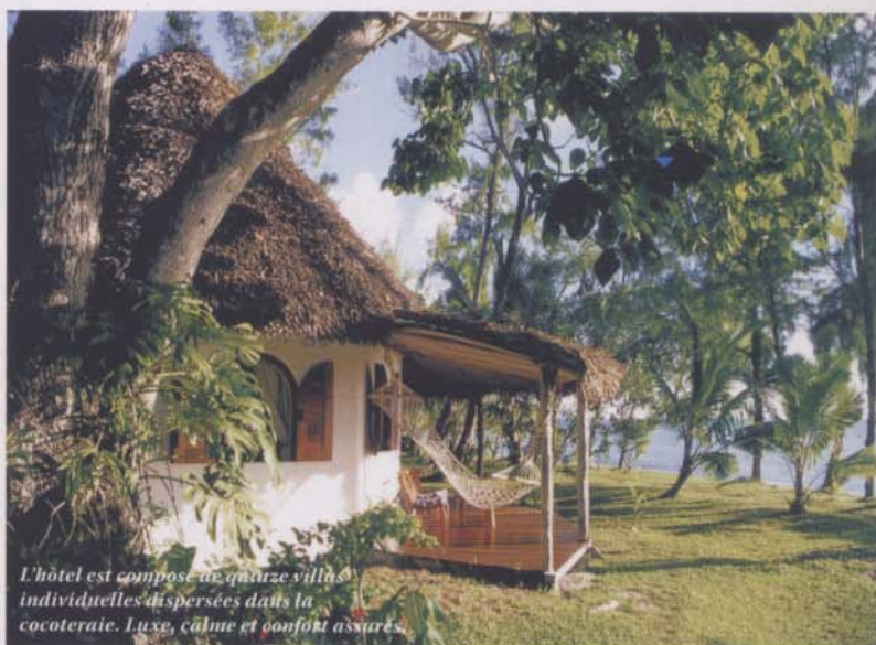
L'hôtel est composé de quinze villas individuelles dispersées dans la cocoteraie. Luxe, calme et confort assurés.

Le Princesse Bora Lodge bénéficie d'une situation propice au ressourcement sous différentes formes. La plage