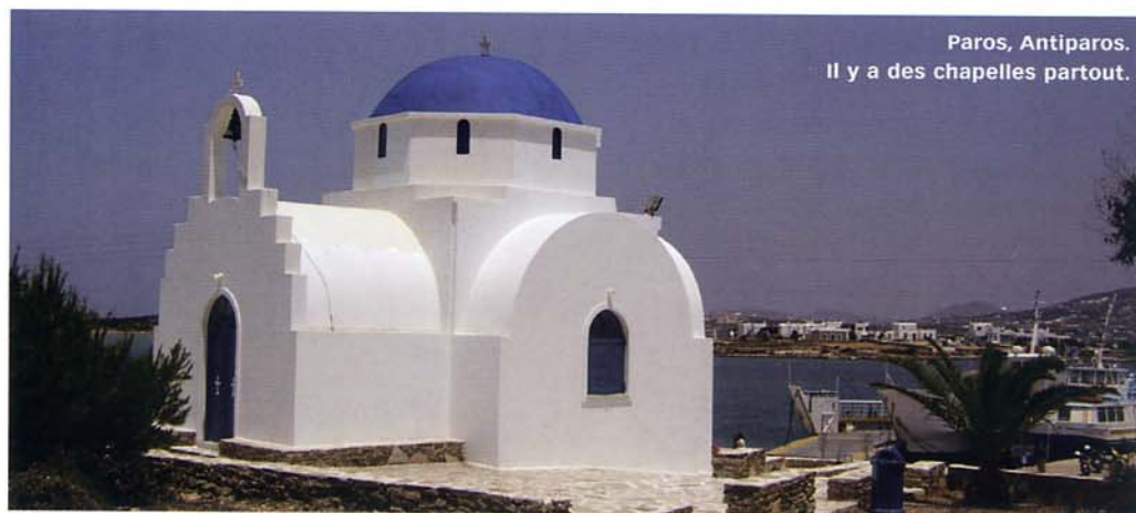
Paros, Antiparos. Il y a des chapelles partout.

Par Jean-Pierre Doiteau