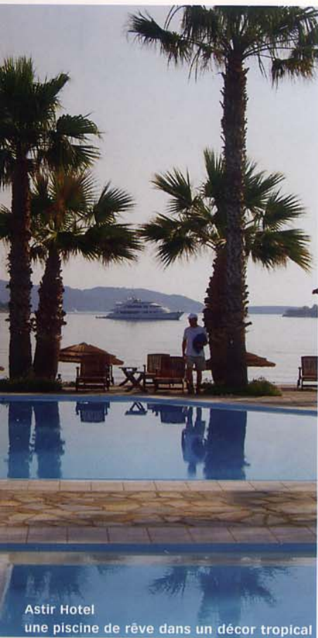
Astir Hotel une piscine de rêve dans un décor tropical

est très actif, avec un va-et-vient permanent de jetboats et de ferries. Là aussi les maisons sont toutes blanches aux éclats bleus. Les rues y sont encore plus étroites et tortueuses, avec des églises et des chapelles presque à chaque coin de rue. L'île est plus vaste. Coup de cœur : monter quelques mètres jusqu'à la chapelle St. Constantin et voir le soleil disparaître derrière le port. Pour passer sur la petite île d'Antiparos, il faut cinq minutes au ferry pour traverser l'étroit chenal qui la sépare de Paros. Cet ancien repaire de pirates est calme et reposant. Le petit port de Kastro (il y avait un ancien fort ici) est occupé de petites barques de pêche aux couleurs vives. La rue principale est agréable et fleurie. A voir.