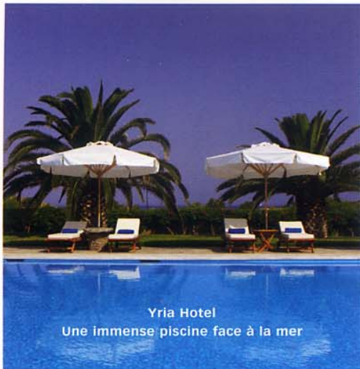
Yria Hotel Une immense piscine face à la mer