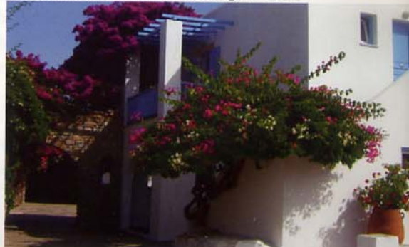
Astir Hotel les chambres couvertes de bougainvilliers