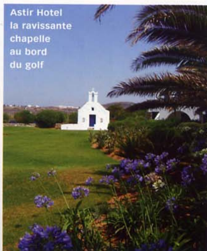
Astir Hotel la ravissante chapelle au bord du golf

L'hôtel Astir of Paros est installé sur la plage, dans la célèbre baie de Kolymithres à 2 km de Naoussa. Il a été construit lui aussi dans le style propre aux îles. Toutes les chambres et suites ressemblent à des maisons cycladiques cubiques avec balcons et terrasses et sont nichées dans des jardins exubérants. Les chambres, très claires avec du marbre et des rideaux blancs et écrus, sont très reposantes. La piscine bordée de palmiers, domine la mer, une immense pelouse et une ravissante petite chapelle prolongent l'ensemble. Installé au bord de l'eau, on se croirait dans un hôtel tropical. L'effet est spectaculaire et très réussi. D'ailleurs VIP et "people" y viennent nombreux des quatre coins du monde ! Des congrès et séminaires mondiaux y sont aussi régulièrement organisés. Et même des mariages avec de somptueux gâteaux. Une galerie d'art expose les œuvres d'artistes grecs connus. Une belle adresse !