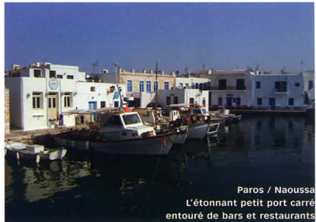
Paros / Naoussa L'étonnant petit port carré entouré de bars et restaurants

Les plages, bordées de bars et de restaurants, sont couvertes de parasols et de chaises longues. Il faut à la tombée de la nuit flâner et se perdre dans les rues piétonnes étroites et sinueuses de Mykonos où se bouscule une joyeuse cohue. Les boutiques de luxe des grandes marques et des bijoutiers sont installées côte à côte avec les boutiques de souvenirs les plus kitsch que l'on peut imaginer ! Et pour dîner, en plein air bien sûr, vous aurez l'embarras du choix, avec d'innombrables restaurants en terrasses sur les quais ou sur d'adorables placettes et rues en pente. Mykonos s'anime et vit la nuit.