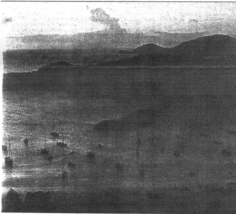
N SPÉCIALE YVES OUELLET

il est impossible d'y apercevoir aucun bateau à partir de la mer. Le passage étroit vers le port est protégé par le fort Berkeley alors que des canons sont disposés à mi-hauteur tout autour de la rade puis sur les sommets de Shirley Heights d'où la perspective domine la baie à l'infini. C'est sur ces hauteurs que des centaines de