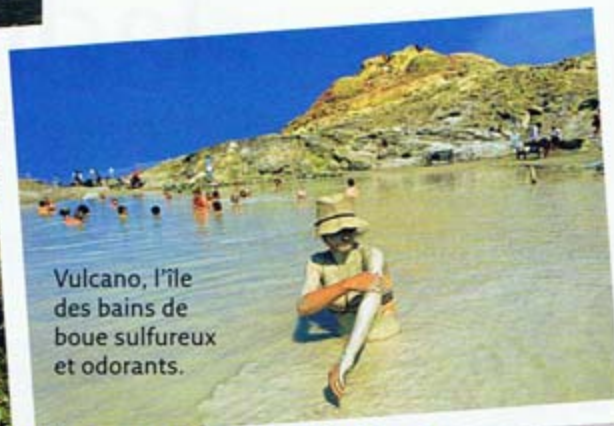
Vulcano, l'île des bains de boue sulfureux et odorants.