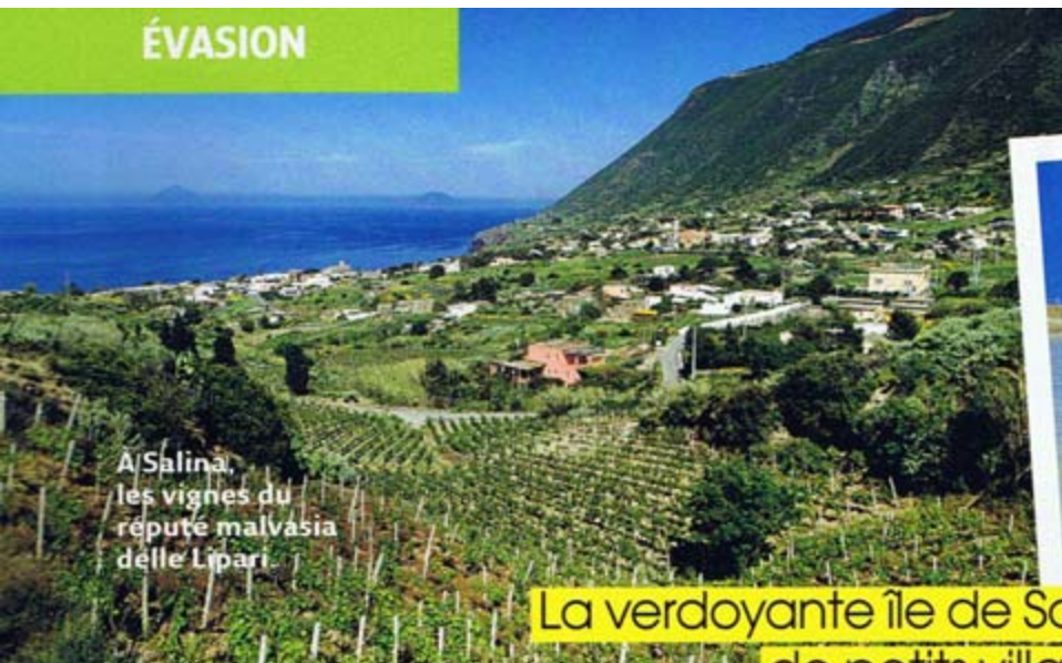
À Salina, les vignes du réputé malvasia delle Lipari.