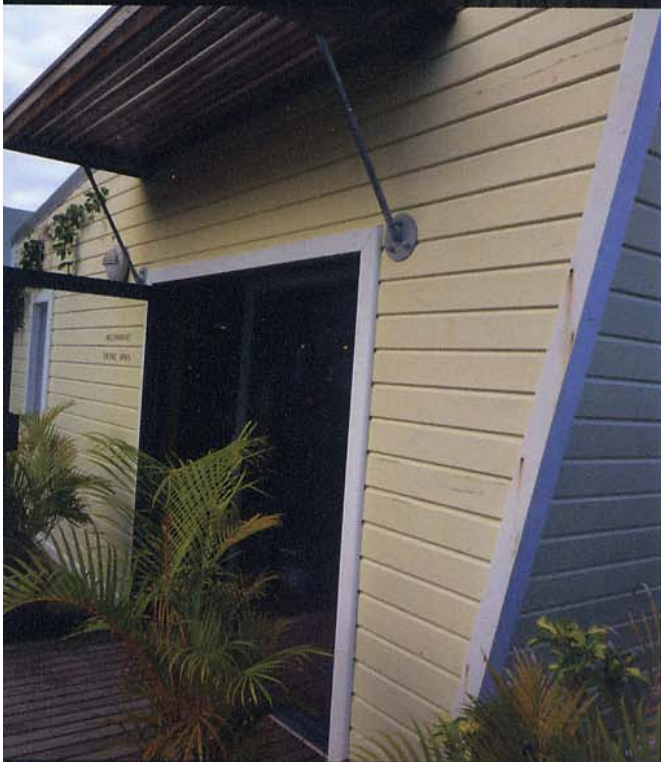
le Restaurant Entre Nous : une architecture zen apaisante Entre Deux - Hôtel Le Dimitile 0262 39 2000