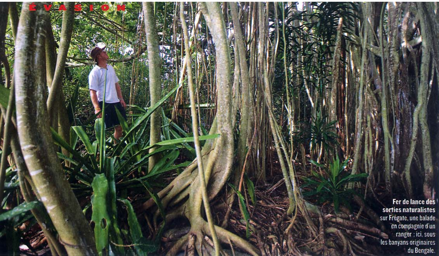
Fer de lance des sorties naturalistes sur Frégate, une balade en compagnie d'un ranger : ici, sous les banyans originaires du Bengale.