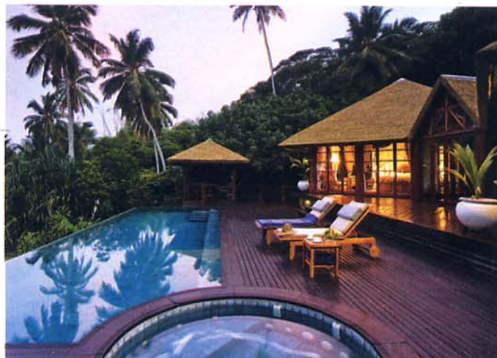
Frégate, éden savamment réhabilité, isolé à 56 kilomètres de Mahé, est aussi une « île-resort » au service exclusif et discret, qui séduit de nombreuses personnalités.