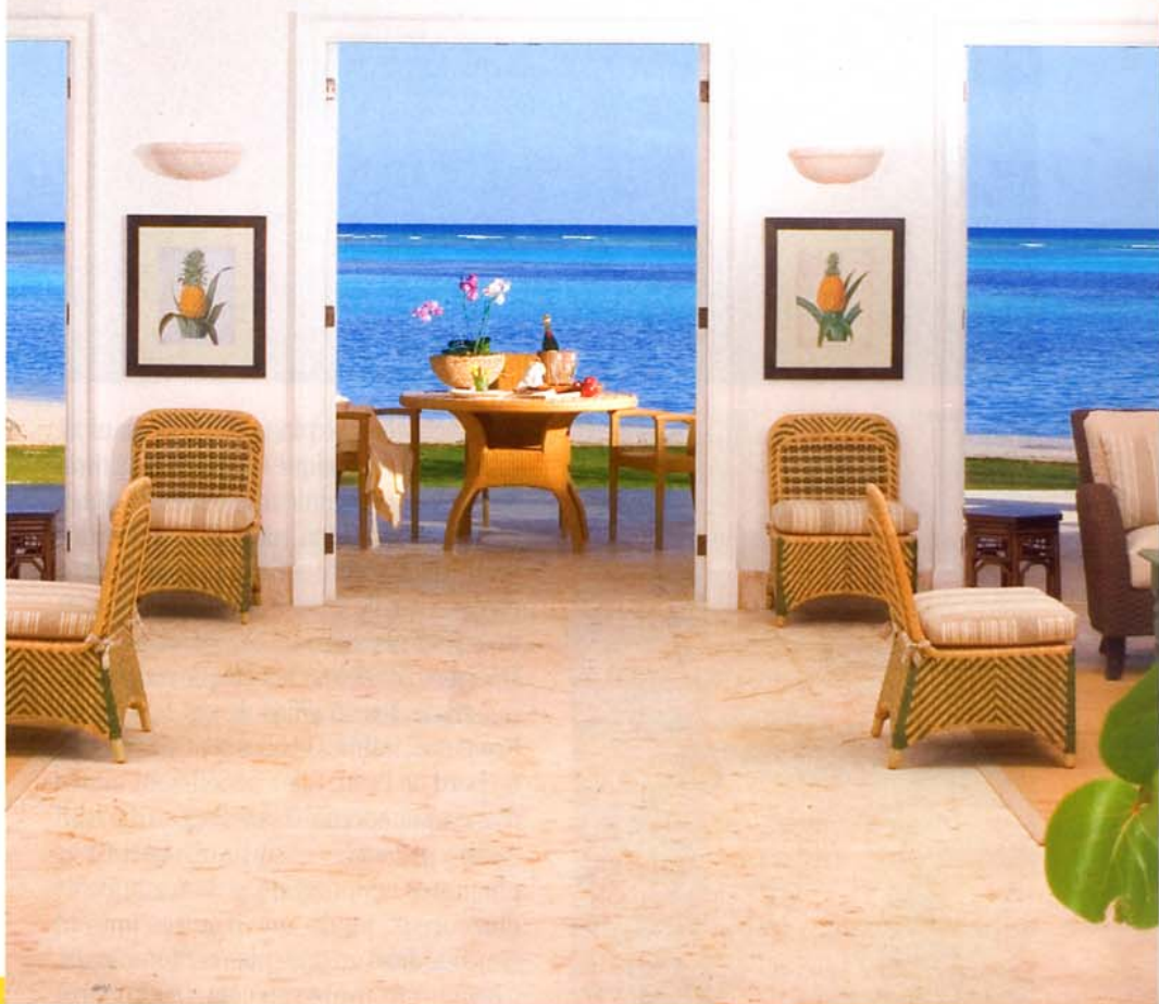
Tortuga Bay Punta Cana, République Dominicaine